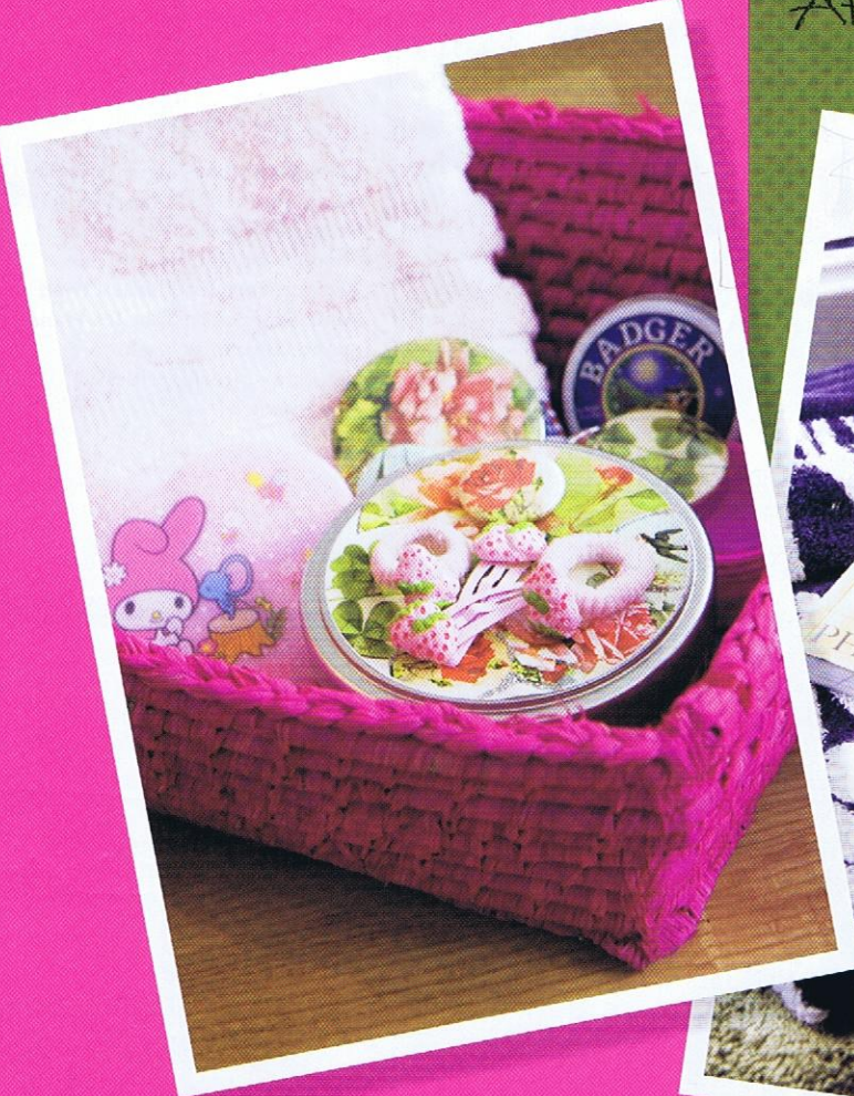
Knallrosa kurv fra R.o.o.m. rommer småtingene: Hårstrikker, neglebørste og den slags er greit å samle på ett sted.