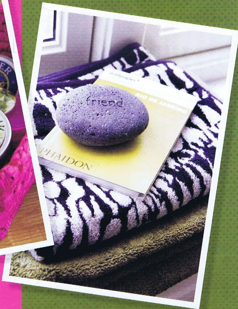
Håndklær fra Gant og Missoni.